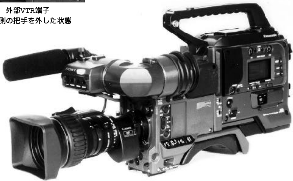
DXC-D30WS・AJ-D90・CA-103Bを組立てた状態

CA-103BはソニーDXC-D30/D30WS/637/537/537A/327/327AなどPRO50ピンコネクター付ビデオカメラと松下電器製DVCPRO VTR AJ-D90, MII VTR AU-45H, S-VHS VTR AG-7450/Aを ドックابل 一体化するアダプターです。(DXC-327はコンポーネント信号が無いいため、AJ-D90, AU-45Hとの組合せはできません。)