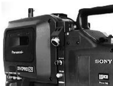
外部VTR端子 VTR側の把手を外した状態